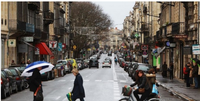
▲ La rue Fondaudège sera en travaux à partir de février.

INFOGRAPHIE Après dix ans de feuilleton, les travaux de la ligne D commencent ce mois-ci. Elle desservira le quadrant nord-ouest en 2019.